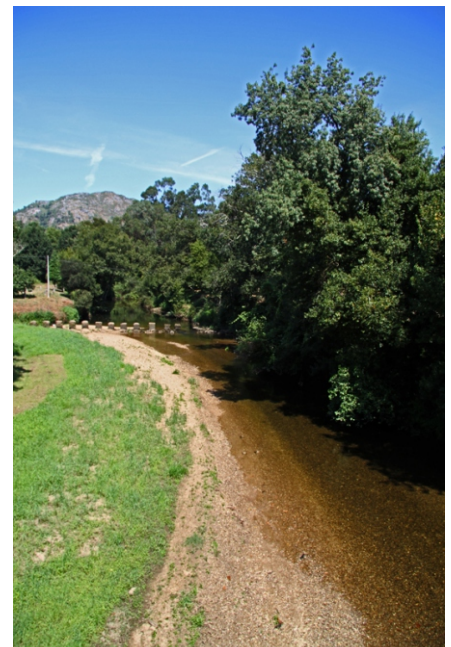
pasos no río Coura en Vilar de Mouros