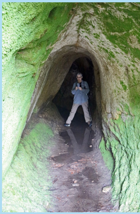
Túnel do Couço de Montefurado