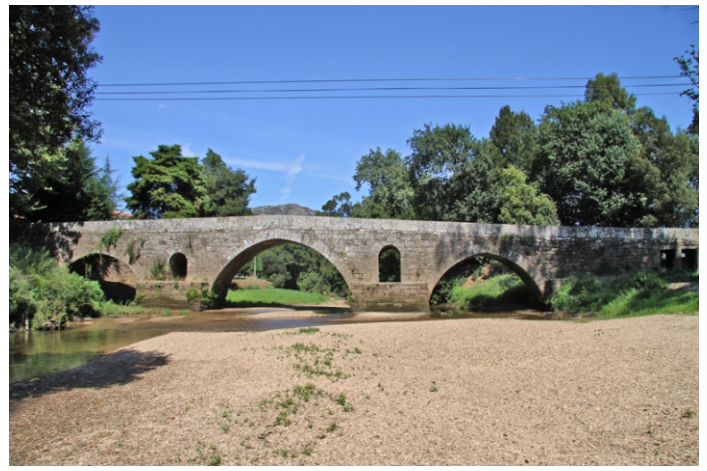
Ponte medieval de Vilar de Mouros