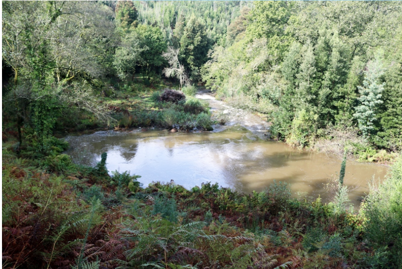
Encoro romano no río Coura en Montefurado