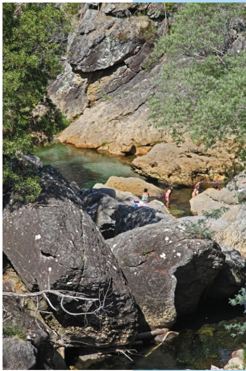
Pozas no rego de San João