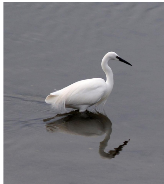
Garzota garça branca pequena ( Egretta garzetta )

O río Coura é un afluente do Miño, o derradeiro pola súa marxe esquerda, que drena territorio portugués nos concellos de Paredes de Coura, Vila Nova de Cerveira e Caminha. Nace na “Paissagem Protegida Serra de Corno de Bico” e despois de percorrer uns 50 km de curso revirado por terreo rochoso ábrese na desembocadura nun amplo esteiro, ao pé da vila de Caminha, moi preto da chegada ao mar do río Miño. É un río ao que paga a pena achegarse porque e doado seguir o seu percorrido en coche xa que a estrada que vai de Caminha a Paredes de Coura discorre polo seu val e a non moita distancia da súa canle, aínda que non hai moitos puntos onde sexa fácil achegarse á auga pola falta de espazos nos que deterse e a pendente do releve, mais atoparemos no traxecto varios puntos de interese nos que é obrigada unha parada.