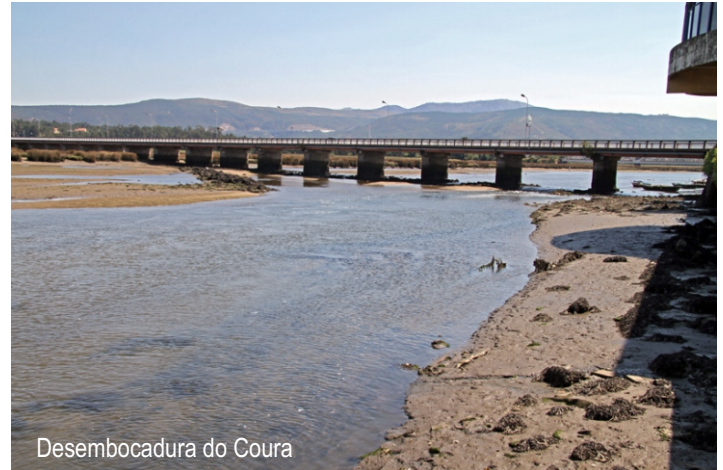
Desembocadura do Coura