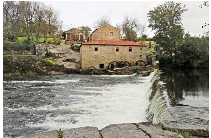
Azenha de Vilar de Mouros, recentemente restaurada.