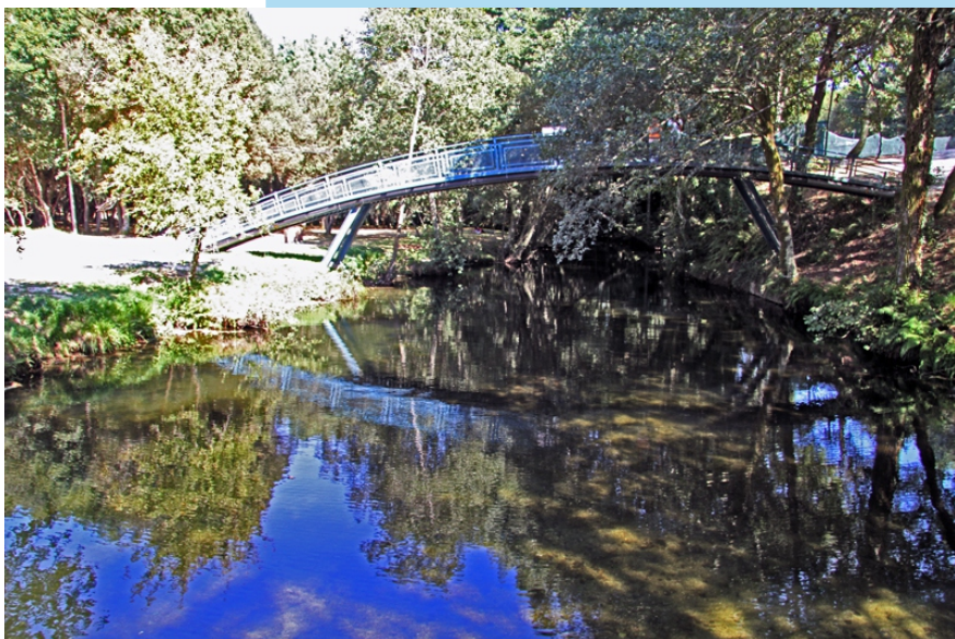
Área de lecer en Paredes de Coura